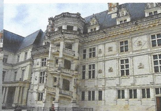
L'escalier du Château de Blois