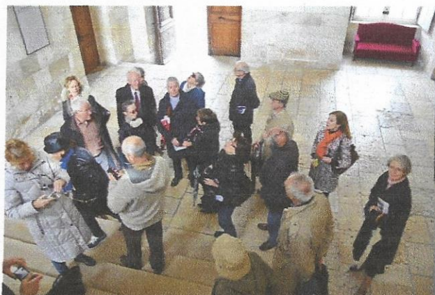
Les membres de l'Association en visite