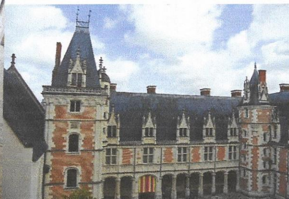
Façade en briques du Château