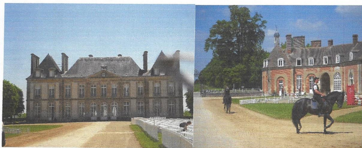
Haras du Pin